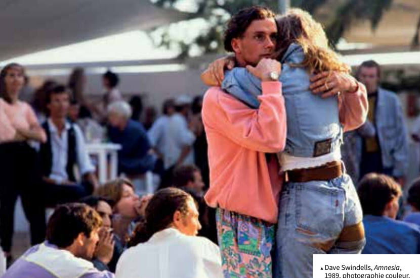
▲ Dave Swindells, Amnesia , 1989, photographie couleur, série « Ibiza 1989 », courtesy de l'artiste et Unravel Productions.