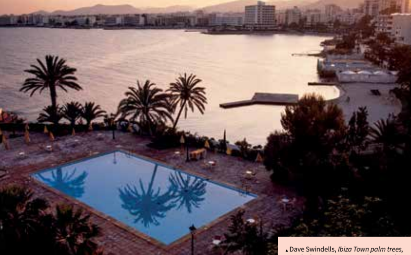
▲ Dave Swindells, Ibiza Town palm trees, pool & bay at 7am , 1989, photographie couleur, série « Ibiza 1989 », courtesy de l'artiste et Unravel Productions.