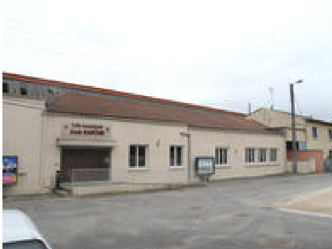
Salle Jean Barthe

Suite à la réhabilitation d'un bâtiment industriel en 2005, la salle polyvalente Jean Barthe, située au coeur du quartier de la Madeleine, permet d'organiser des manifestations ne devant pas nuire au proche voisinage.